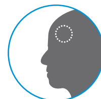
Temperatura sem contato