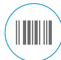
Leitor de Código de Barras