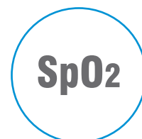
Oximetria de pulso